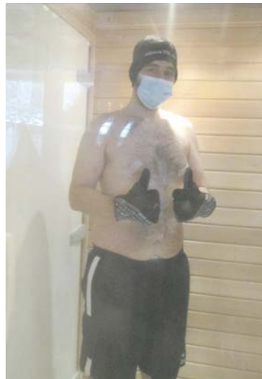
Bei -10 Grad: alles in Ordnung...

Ich bin dann doch irgendwie froh, als ich nach drei Minuten wieder raus kann. Man fühlt sich tatsächlich wacher und vitali-